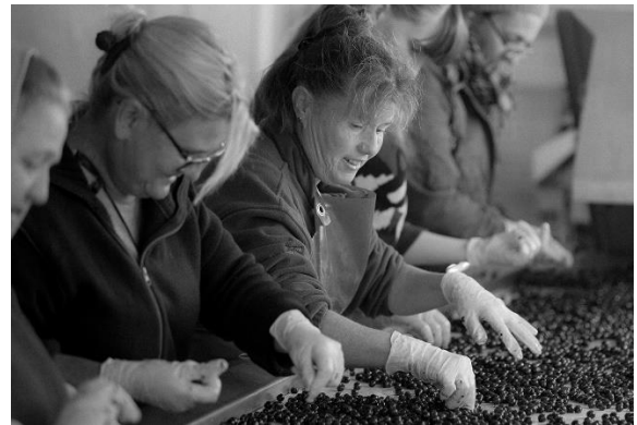
Sortiertisch auf La Pointe