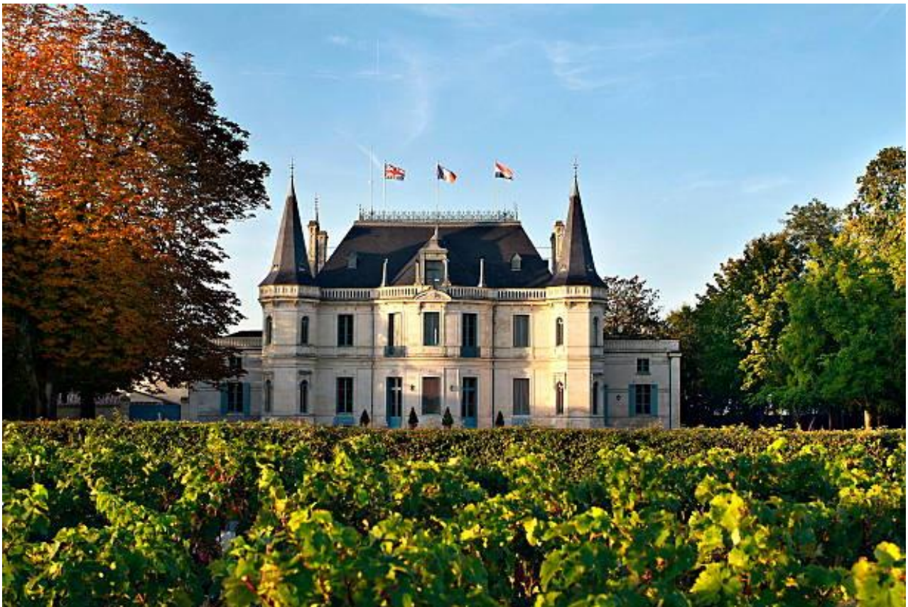
Château Palmer, Margaux

Wine & Dine Fricktaler Weinfreunde 7. November 2025 Restaurant Post, Bözen